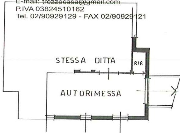
PIANO SEMINTERRATO H.245